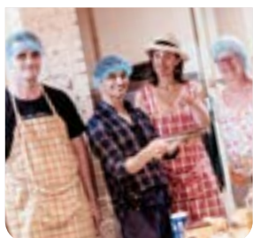
Agriculture urbaine & économie circulaire page 2 et page 8

A Chaville et au Jardin du Piqueur, Espaces ouvre deux restaurants et crée des emplois en insertion dans un secteur en quête de salariés qualifiés.