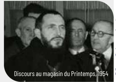
Discours au magasin du Printemps, 1954

Cette assemblée a adopté les orientations stratégiques suivantes : agir pour une révolution écologique par l'économie du réemploi et l'économie circulaire, agir pour une société solidaire qui accueille et accompagne, agir pour être catalyseur de paix face aux horreurs des guerres.