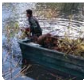
Eau, milieu, écopâturage page 6