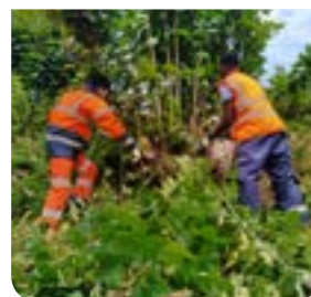
Insertion & formation page 9