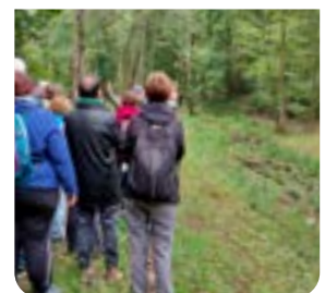
Actualités page 10