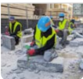
Biodiversité & espaces verts page 4