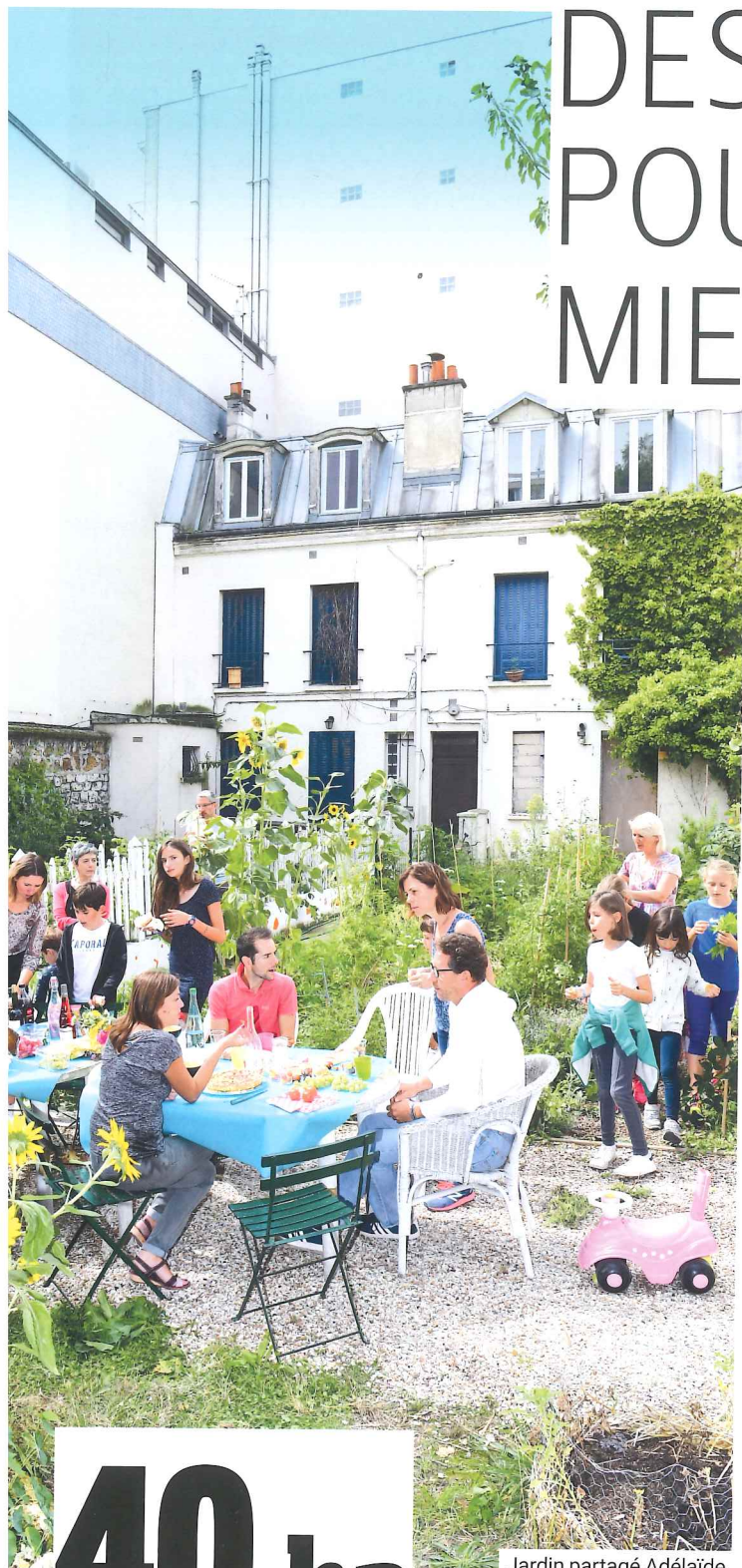
Jardin partagé Adélaïde.

Avec 40 hectares d'espaces verts (sur 417 hectares), 7 680 arbres et 2 100 mètres carrés de prairies fleuries, Courbevoie est, malgré sa densité urbaine, une ville verte. Elle a d'ailleurs obtenu en 2015 le trophée Fleur d'Or, décerné cette année-là à neuf villes françaises par le jury du Conseil national des villes et villages fleuris. La Ville s'efforce d'étendre, chaque fois que possible, l'emprise des espaces verts en créant, non pas de grands parcs, mais des "pocket gardens" qui bénéficient de la moindre surface disponible. En dix ans, leur superficie a doublé. Depuis 2014, ont ainsi été créés les jardins partagés Fauvelles, le square Raspail-Kilford, le square Normandie et ses jardins partagés, le jardin Adélaïde, le jardin partagé de la résidence ABG, le Jardin du souvenir au cimetière des Fauvelles, la végétalisation de l'allée des Vignerons ou encore les aménagements paysagers de la rue des Lilas-d'Espagne et de l'avenue du Parc. Ce faisant, la Ville s'inscrit dans une stratégie paysagère durable, destinée à améliorer le cadre de vie tout en associant les Courbevoisiens via des jardins pédagogiques, installés dans 13 écoles, des ruches, des hôtels à insectes, etc. Courbevoie s'est également dotée d'une charte de l'environnement et d'un projet d'aménagement et de développement durable (PADD).