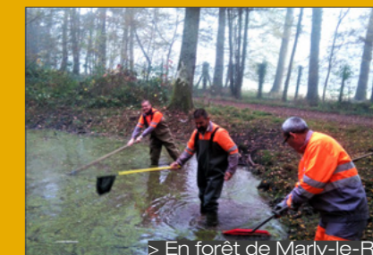
> En forêt de Marly-le-Roi

En 2016, l'ONF a confié des opérations aux équipes d'Espaces dans les forêts du Département des Yvelines. 1 223 heures d'insertion ont été réalisées dans le cadre de ces prestations dans les forêts de Beynes, l'Hautil, Marly-le-Roi, Mézy-sur-Seine, Port-Royal, Rambouillet, Saint-Germain-en-Laye et Versailles. Elles concernent l'entretien et la mise en lumière de mares forestières, l'entretien de pistes cavalières, de prairies et de sentiers de randonnée.