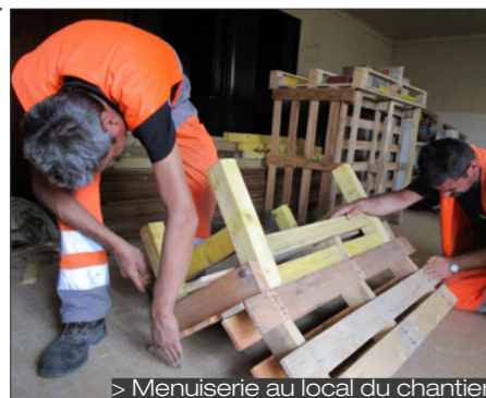
> Menuiserie au local du chantier

Le chantier d'insertion Gares ferroviaires Yvelines a en charge l'entretien et la valorisation écologique des espaces verts de 12 gares de la ligne L du Transilien dans le cadre d'une convention passée avec SNCF. Le chantier entretient également une friche ferroviaire située à proximité de deux Zones