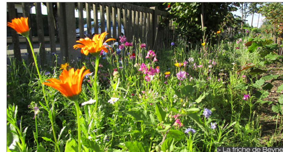
> La friche de Beynes