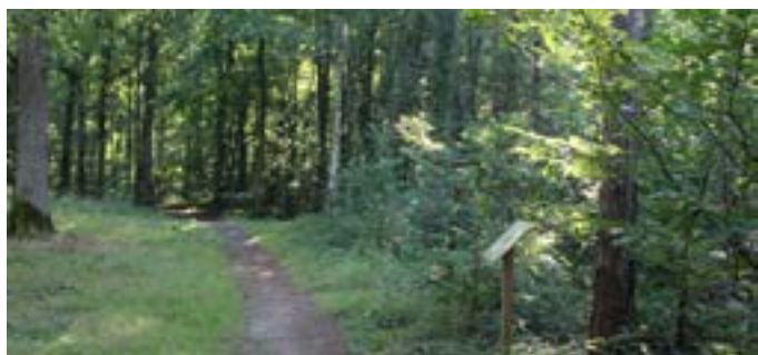
▼ Forêt à Beynes (78)