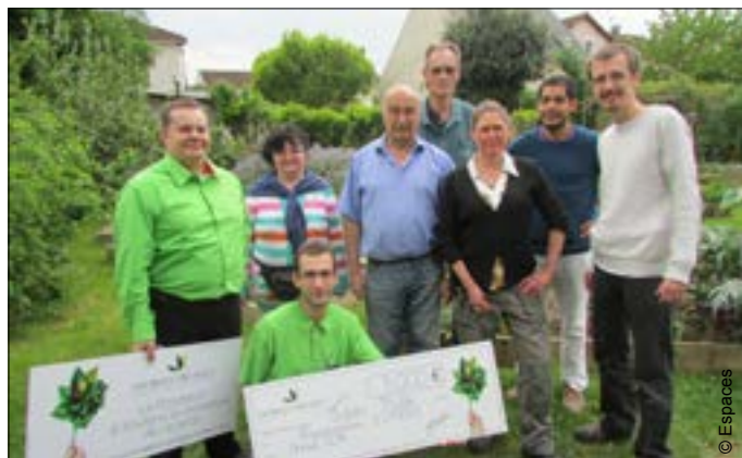
▼ Remise du prix de la Fondation Georges Truffaut au Jardin solidaire de Clamart, le 30 avril 2014.