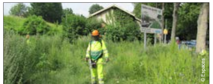
▼ Friches des berges de Seine à Issy-les-Moulineaux

presque aucune place à la végétation existante, à l'histoire des lieux, aux aménagements réalisés par des centaines d'éco-cantonniers qui auraient pu participer aux travaux d'aménagements comme cela a pu se faire pour le parc départemental de l'île Saint-Germain à la fin des années 1990. Ainsi en va-t-il de la phase de réalisation des grands aménagements où souvent la technique ne laisse pas de place au passé, ni au travail avec les associations et à l'emploi de personnes en difficultés, éléments pourtant porteurs d'avenir.