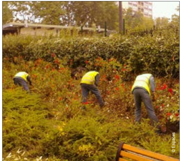
▼ Nouveau chantier d'insertion à Antony