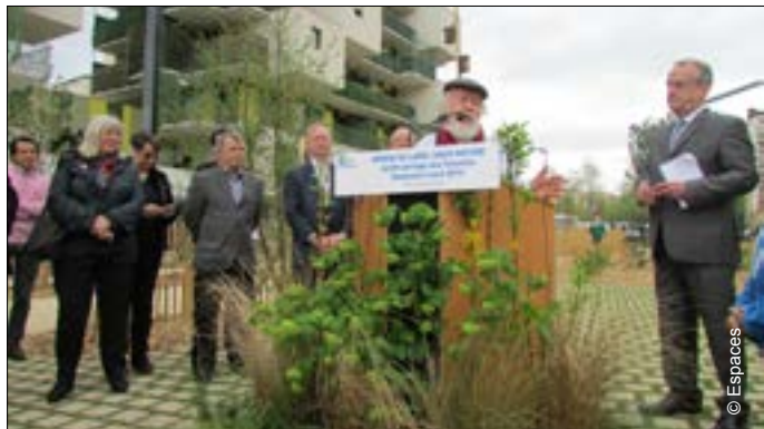
▼ Labellisation du Jardin des Fauvelles à Courbevoie, le 6 avril 2014.

Pour plus d'informations : Si vous souhaitez rejoindre le groupe de bénévoles et que vous habitez Courbevoie, contactez le comité d'animation du jardin partagé sur : jardin.fauvelles@association-espaces.org