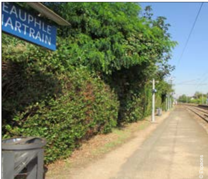
▼ Gare de Villiers Neauphle Pontchartain