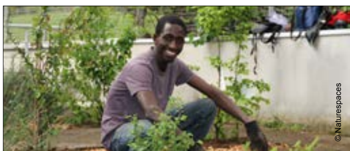
▼ Un ouvrier à l'œuvre dans une copropriété de Boulogne-Billancourt