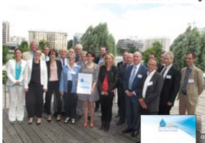
▼ Signature du contrat de bassin Plaines et coteaux de la Seine centrale urbaine le 17 juin, sur l'île de Monsieur à Sèvres (92)