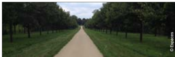
▼ Allée des Mortemets à Versailles