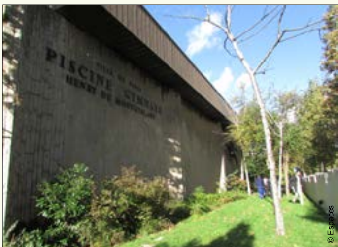
▼ Piscine Henry de Montherlant, Paris 16 e