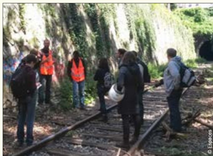
▼ Visite de la Petite ceinture, le 22 mai à Paris 15 e