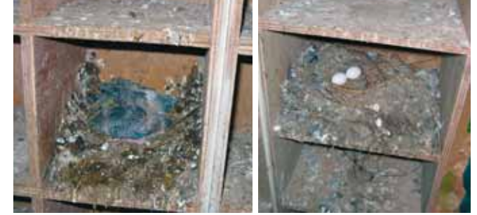
Les oiseaux pondent à l'intérieur du pigeonnier

Les pigeons mangent les parterres de fleurs pour combler un déficit en vitamines et minéraux. Le pigeonnier permet de distribuer une nourriture adaptée aux volatiles.