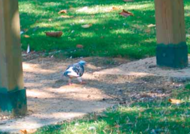
Le pigeonnier, lieu de rassemblement de la population des pigeons