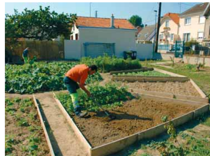
La préparation de la prochaine récolte et le travail des jardiniers

Le Jardin solidaire de Clamart a vu le jour en septembre 2004, à la suite d'une étude de faisabilité pour valoriser trois parcelles de réserve foncière en friche situées sur le plateau à la jonction des quartiers de la Plaine et Trivaux-la-Garenne. A la demande de la mairie de Clamart, l'association Espaces a mené l'enquête auprès des habitants du quartier et de la commune afin de définir la nature des aménagements à réaliser sur le site concerné de telle sorte qu'ils puissent avoir la meilleure utilité sociale pour les riverains. La consultation auprès des services municipaux, des associations et des habitants a amené Espaces à proposer la création du Jardin solidaire. Il s'agit d'un aménagement réversible sur lequel la mairie a prévu de construire ultérieurement un équipement public.