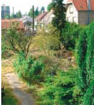
Le terrain en friche avant le Jardin solidaire