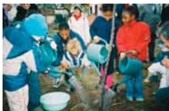
La plantation d'un abricotier lors de l'inauguration du jardin

Le Jardin solidaire de Clamart a vu le jour en septembre 2004, à la suite d'une étude de faisabilité pour valoriser trois parcelles de réserve foncière en friche situées sur le plateau à la jonction des quartiers de la Plaine et Trivaux-la-Garenne. A la demande de la mairie de Clamart, l'association Espaces a mené l'enquête auprès des habitants du quartier et de la commune afin de définir la nature des aménagements à réaliser sur le site concerné de telle sorte qu'ils puissent avoir la meilleure utilité sociale pour les riverains. La consultation auprès des services municipaux, des associations et des habitants a amené Espaces à proposer la création du Jardin solidaire. Il s'agit d'un aménagement réversible sur lequel la mairie a prévu de construire ultérieurement un équipement public.