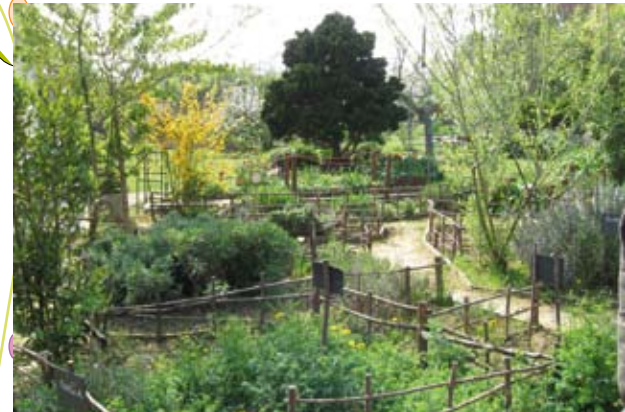
Jardin solidaire de Clamart

Realisations et photos Espaces, Mars 2010 Support imprimé à L'Éco-carbonn' n°36, janvier 2010