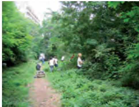
Les volontaires de SolidarCité dégagent des herbes envahissantes

Toute l'équipe d'Espaces remercie les 22 salariés volontaires de PPR-Purchasing pour leur participation au nettoyage et à l'entretien du tronçon de la petite ceinture ferroviaire du 16 e arrondissement de Paris, le 8 juin 2007. Les résultats sont manifestes ! 25 tee-shirts d'Espaces en coton biologique ont été achetés par l'association SolidarCité du groupe PPR suite à cette opération.