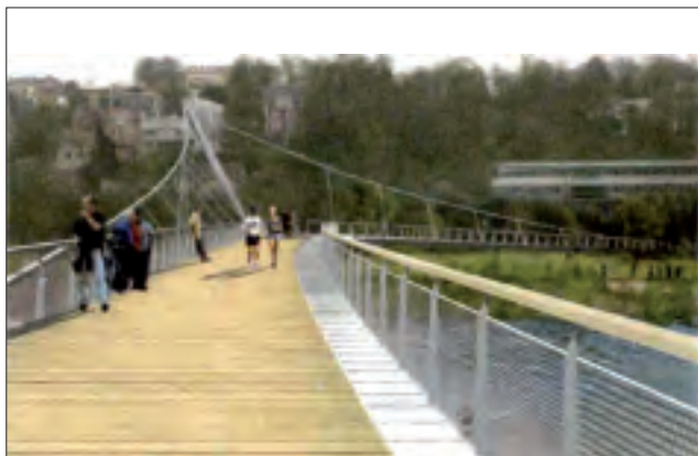
Dessin de la future passerelle qui reliera Sèvres à l'île Seguin

Exceptionnel également, le site : un des plus beaux secteurs de la rive gauche de la Seine entre Paris et Sèvres, traversé par le chemin de halage. Celui-ci est bordé de talus renaturés par Espaces depuis 1995, en partenariat avec la Communauté d'agglomération Val de Seine, la Ville de Sèvres et Renault Sicofram, et du chemin des mégalithes, œuvre « land art » réalisé par l'artiste Brigitte Sillard et les éco-cantonniers d'Espaces, inauguré le 6 juillet 2000 ( L'écho-cantonnier n°9, septembre 2000 ), dont Espaces étudie la « migration » totale ou partielle ; le site se trouve abriter un écosystème spécifique de berge avec une biodiversité très riche, notamment sur la risberme en pied de berge, exemple rare de colonisation végétale spontanée sur le lit du fleuve urbain.