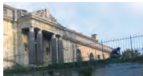
Le penseur avant sa disparition

Une petite enquête permis à Espaces d'apprendre que la statue de bronze se trouvait à Rome, au palais du Quirinal, afin d'y représenter la France à l'occasion du cinquantième anniversaire des traités de Rome. Espaces apprit également, par plusieurs responsables et visiteurs du musée, que le musée Rodin à Paris disposait sûrement d'un autre exemplaire du « Penseur ».