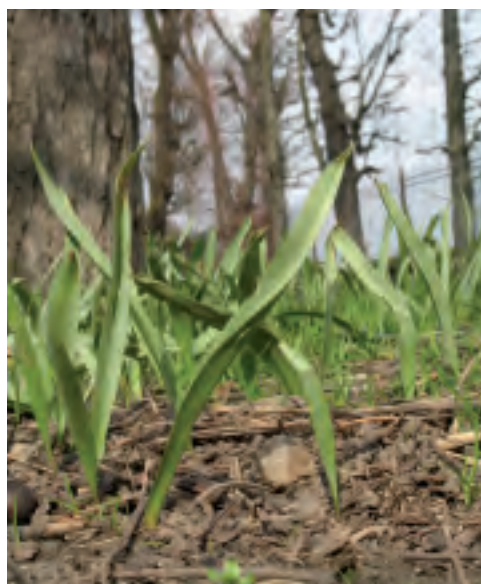
La tulipe sauvage

Les stations observées dans le parc de Saint-Cloud comprennent chacune entre 100 et 300 pieds, qui forment des plaques de feuilles dans les intervalles de l'alignement de marronniers. Sur ce type de station, la tulipe fleurit rarement.