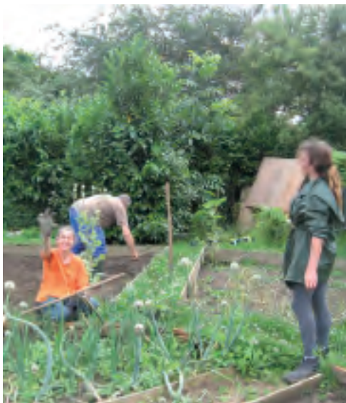
L'atelier de redynamisation sociale se met en place aux jardins