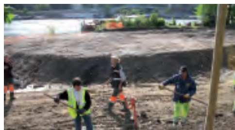
Les éco-cantonniers déplacent de la terre pour conserver les graines issues du terrain sur le parc de l'île de Monsieur en cours de création.

Les éco-cantonniers du chantier d'insertion Coteaux berges amont y entretiennent le chemin de halage (ramassage des feuilles, taille de la végétation...) et effectuent un nettoyage hebdomadaire des berges de Seine, en partenariat avec le Conseil général des Hauts-de-Seine. Ils assurent par ailleurs la gestion paysagère et écologique des berges, en étroite relation avec l'agent de veille écologique, Bruno Macé, qui a réalisé un important travail d'inventaires floristiques depuis de nombreuses années. Plusieurs zones d'espèces à protéger telle que l'Aristolochie ou la Prêle ont été délimitées grâce à ce travail, ce qui permet à l'équipe d'assurer leur gestion au plus près et de sensibiliser les usagers.