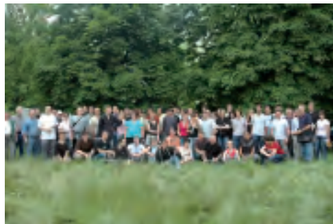
L'équipe au grand complet de Ricoh France avant le nettoyage.